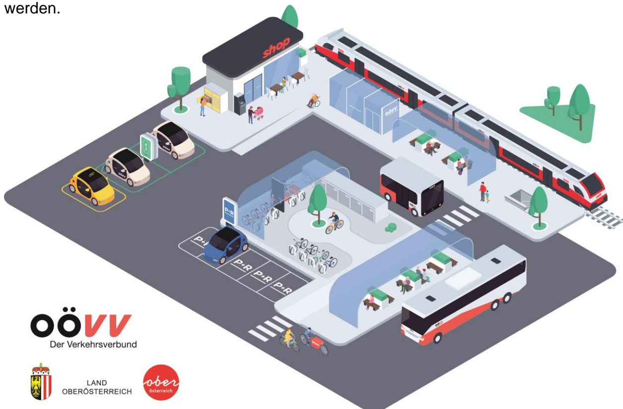
Abb1. So könnte ein Mobilitätshub zukünftig aussehen: Ein Mobilitätsmix aus öffentlichen Verkehrsmitteln, Sharing- und On-Demand-Diensten

Diese Mobilitätshubs werden an intermodalen Knotenpunkten (z.B. Bahnhöfe, P&R Anlagen, ÖV-Knoten, etc.) für den optimalen, auf die Anforderungen des Standorts ausgelegten Angebotsmix an Mobilitätsdiensten sorgen. Vor allem der ländliche Raum wird von der Schaffung dieser Mobilitätsknoten profitieren. Bis es zur tatsächlichen Umsetzung der derzeit in Ausarbeitung befindlichen Maßnahmen kommt, sollen zunächst lokal begrenzte Pilotprojekte realisiert werden.