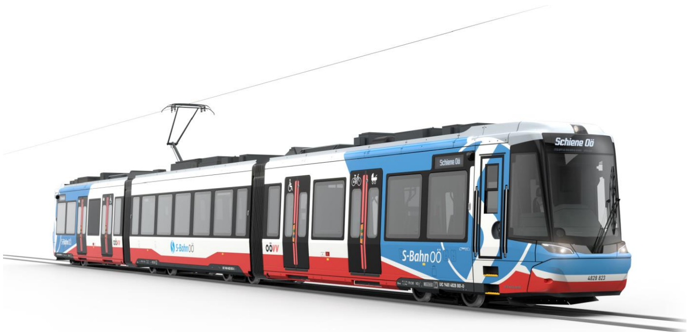
Abb.2. Die ersten TramTrains sollen 2026 auf der Linzer Lokalbahn zum Einsatz kommen. Eine Option auf 50 weitere für das Regional-Stadtbahn Linz Projekt hat sich das Land ÖÖ bereits gesichert.

zu diesem Zeitpunkt haltenden Verkehrsunternehmen bzw. Konzessionären zur Nutzung übertragen. Die Reinigung des Areals wurde von der Stadt Linz übernommen. Leider hat diese geschaffene Form der Zuständigkeit zu keiner aktiven und ausreichenden Bewirtschaftung des Busterminals geführt, weshalb sich das Busterminal gegenwärtig in keinem zufriedenstellenden Zustand befindet. Durch die geplanten Modernisierungsmaßnahmen wird diese wichtige Mobilitätsdrehscheibe endlich den Anforderungen und Ansprüchen der vielen tausenden Fahrgäste gerecht. Neben einer Steigerung der Aufenthaltsqualität, erwartet man sich von den Maßnahmen außerdem Verbesserungen im tagtäglichen Betrieb sowie beim Faktor Sicherheit und Sauberkeit. Rund 6,9 Millionen Euro werden in die Sanierungsmaßnahmen des Busterminals investiert. Die Baumaßnahmen sollen 2025 starten und werden von der Schiene ÖÖ im Herbst 2024 ausgeschrieben und in weiterer Folge vergeben. Die anschließende Erhaltung und der Betrieb werden nach dem Umbau ebenso von der Schiene ÖÖ übernommen.